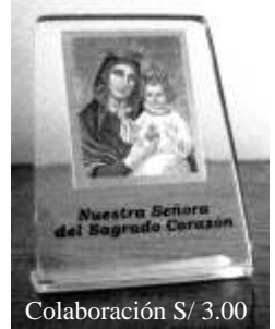
Colaboración S/ 3.00

Al final ofrecimos un porta-foto con la imagen de Nuestra Señora del Sagrado Corazón como recuerdo de este III Aniversario de nuestra Asociación. Lo pueden adquirir en nuestra sede por una colaboración de tres Soles. Muchas gracias por su asistencia.